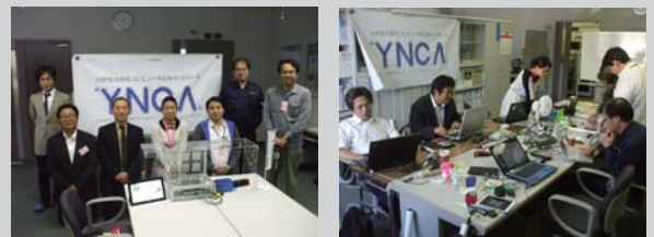
YNCA 会員企業による展示会出展合同プロジェクト